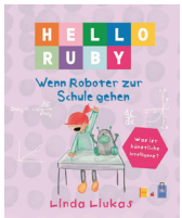
„Hello Ruby – Wenn Roboter zur Schule gehen“ von Linda Luikas